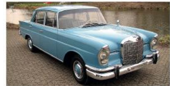
1961 Mercedes 220 Sb, schuifdak!