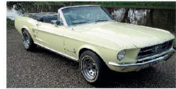
1967 Ford Mustang cabrio