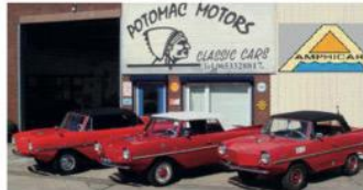
Gezocht alles wat met Amphicar te maken heeft