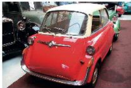
Bmw 600. Nieuw gespoten