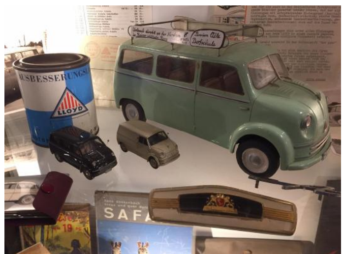
Prachtige spullen in de vitrines