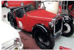
1936 Austin Nippy