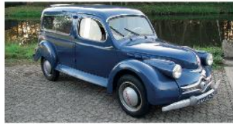
1946 Panhard Dyna X Commercial