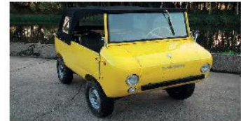
1969 Fiat Ferves Ranger 4x4