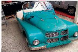
1951 Kleinschnittger ex-Rusland