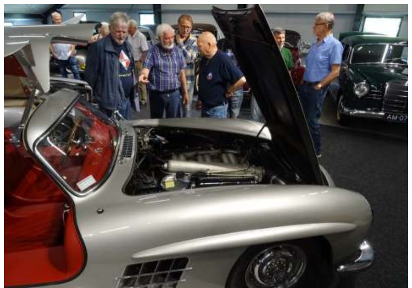
De aluminium 300 SL van 1955 maakt diepe indruk met zijn geschatte waarde van € 10.000.000,-