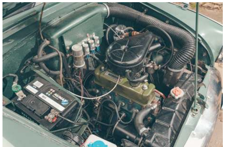
De 1489 cc viercilinder Morris