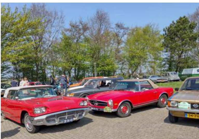
Hieronder fotograaf Ton Coebergh van de Braak meteen van zijn mooie klassiekers, een Plymouth Valiant uit 1966