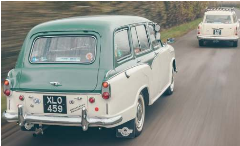
Britse jaren vijftig Barok; 'two-tone' en veel chroom

Een voor de hand liggende en pragmatische keuze, nadat Austin en Morris in 1952 waren gefuseerd onder de vlag van de BMC.