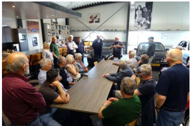
Een eerste blik op de Mercedes collectie