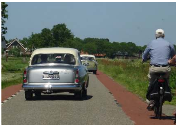
Een mooi plaatje in de Eempolder

Het was even wennen, geen Meerdaagse van onze club in het voorjaar, maar het zat er helaas niet in. Geen van de leden zag het zitten om, al dan niet samen met andere leden, een weekendevenement te organiseren. En laten we wel wezen, het is ook niet zomaar iets. Je moet er tijdig mee beginnen, vooral met het reserveren van accommodatie, en dan moet je ook nog eens diverse dagactiviteiten en ritten gaan regelen. De stijgende gemiddelde leeftijd van ons ledenbestand en dus de spankracht van de leden gaat tegen ons werken, en de kosten van hotelovernachtingen en diners dreigen ook wel een belemmerende factor te worden. Kortom, geen Meerdaagse, maar wel een Eendaagse.