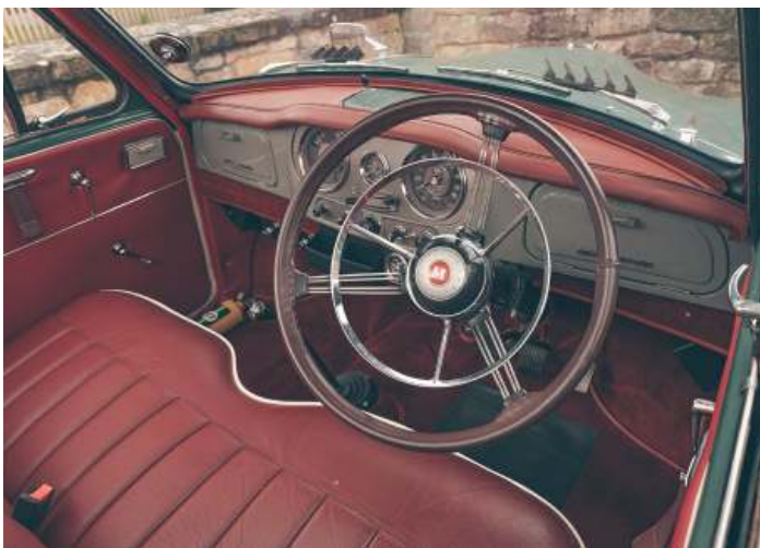
"Three is a crowd" op de voorbank

De mollige, geplooiden lederen voorbank, met een inkeping voor de versnellingspook op de vloer, biedt in theorie plaats aan drie personen, waardoor dit een zeszitter is, maar bestuurders zullen elke keer als ze schakelen op intieme voet staan met hun middelste passagier. De achterbank scoort beter dan die van de Borgward doordat er een neerklapbare armleuning is. Beide auto's hebben trouwens voldoende beenruimte.