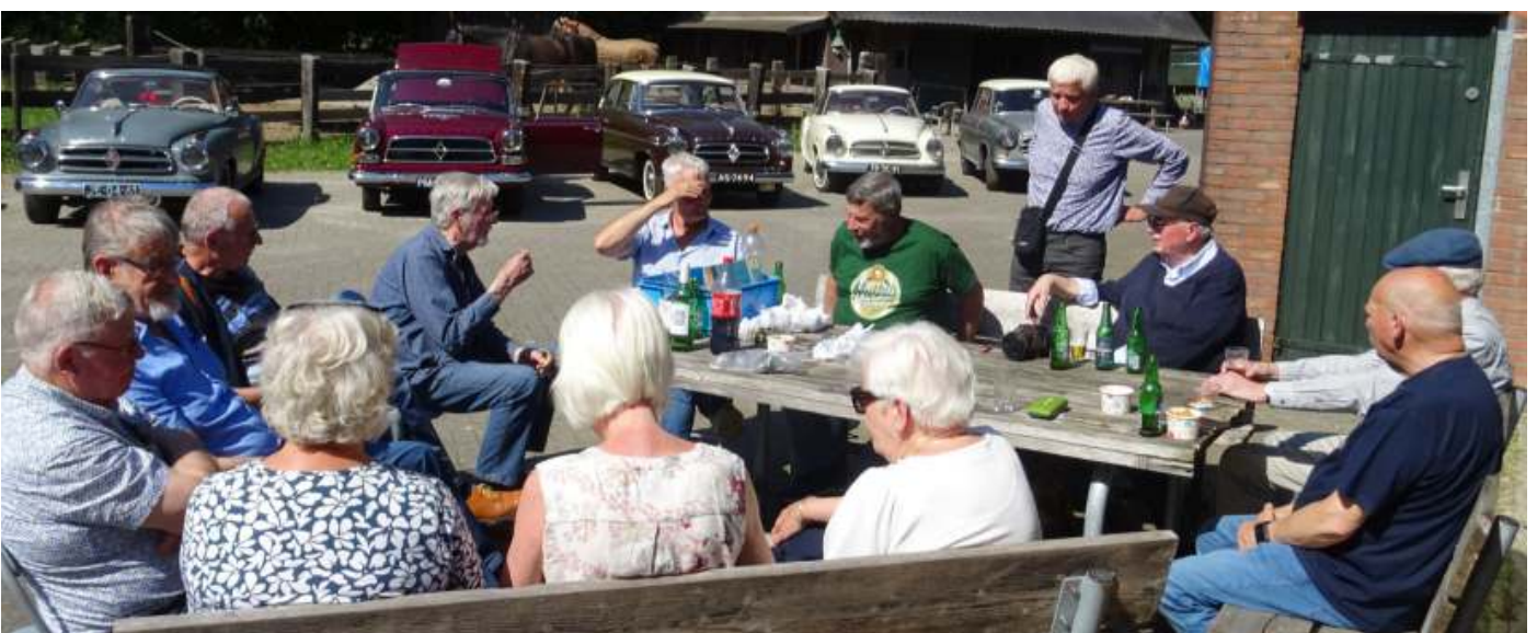
Onder: een gezellige nazit ter afsluiting