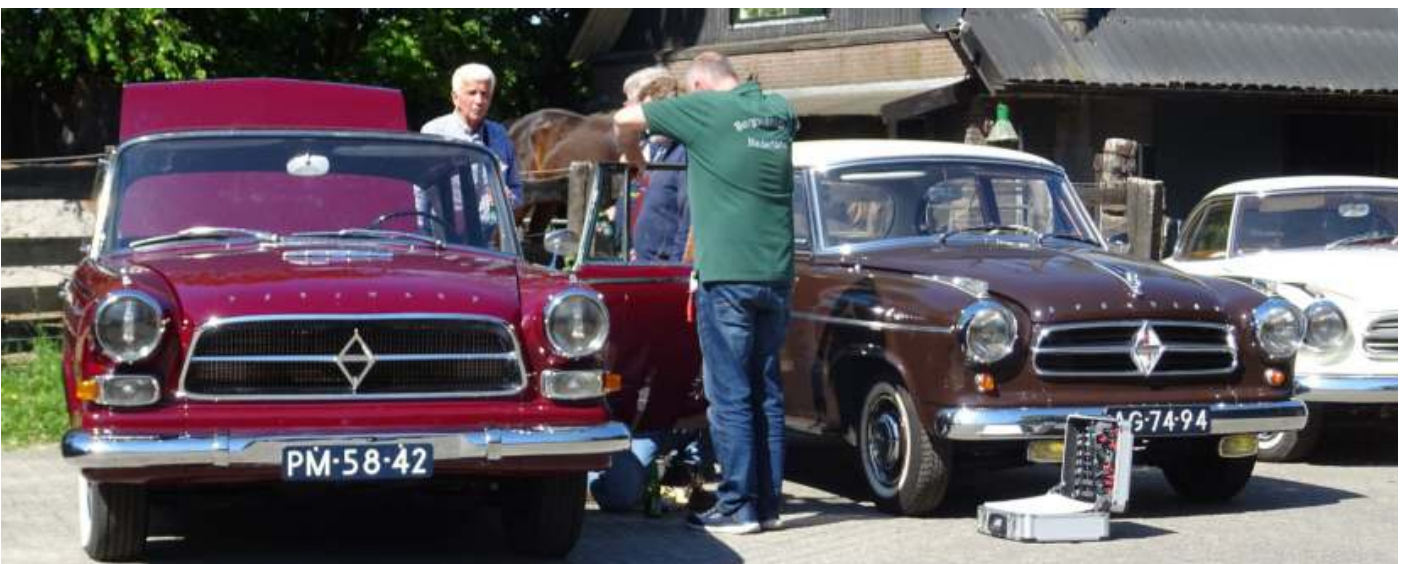
Boven: de weggezakte zijruit van de P100 wordt hersteld.