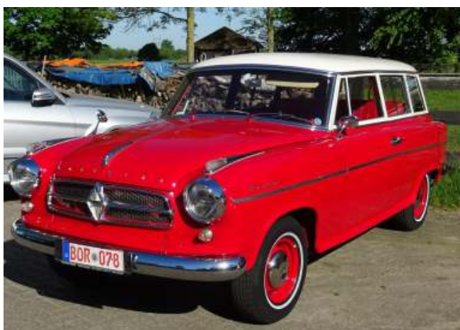
De fraaie Isabella combi van Ullrich Kotte