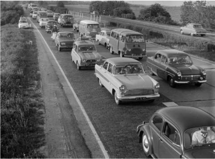
Linksboven: Leuk, zo'n file! Zoek de Isabella coupé.