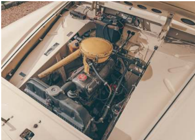
De 1493 cc viercilinder Borgward

Beiden gingen een nieuw autotijdperk in waarin je, door simpelweg een verlengde daklijn, plus de toevoeging van een achterklep en configureerbare achterbank, bijna alle prestatiekenmerken van een sedan kon behouden, maar dan wel met een sterk verbeterde bruikbaarheid en veelzijdigheid. Tot dan toe was het Britse publiek nauwelijks gewend aan het verschijnsel van de stationcar. Borgward was destijds weinig bekend en ook nog eens Duits, wat nog minder hielp.