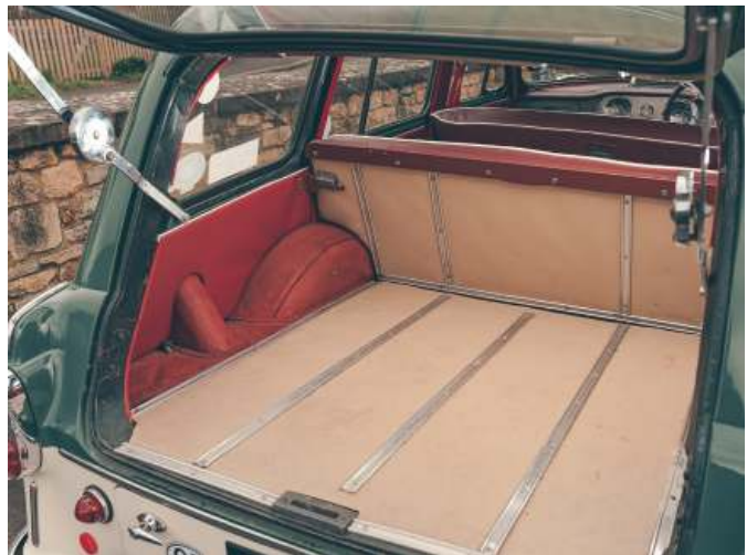
Een naar boven scharnierende achterklep

Het rijden met de Morris gaat soepeler dan het ontwerp doet vermoeden. Je voelt je wel een beetje als een ouderwetse Londense taxichauffeur die over het stuur tuurt, maar het dashboard is overzichtelijk en de pedalen zijn afgewogen geplaatst. Je moet wel wat sneller opschakelen dan bij de Borgward en dat betekent dat boven de 50-55 mijl p/u de motor druk klinkt. Er is veel "body roll", wat minder prettig is als je zo hoog zit, terwijl de remmen wat levenloos aanvoelen. Maar, afrondend, de Morris was met zijn two-tone kleuren een opvallende verschijning en samen met de Borgward aantrekkelijk genoeg in de opkomende markt voor stationwagens.