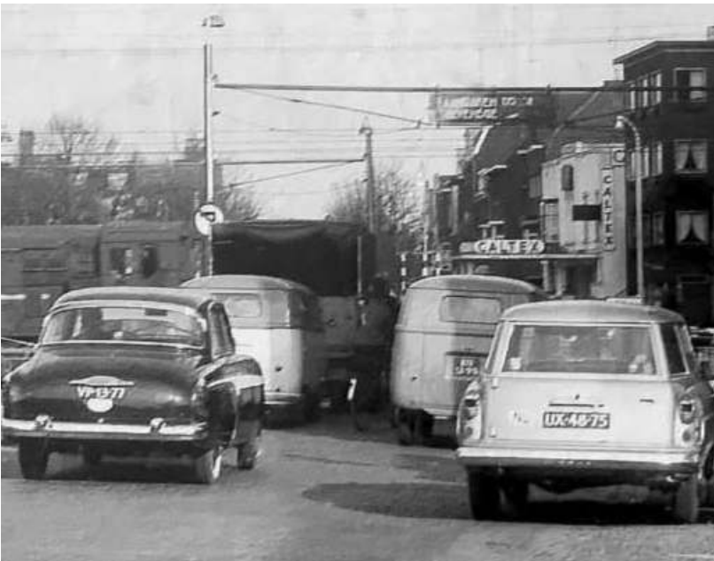
Linksboven: Een Vauxhall Velox, twee VW busjes en een Combi.