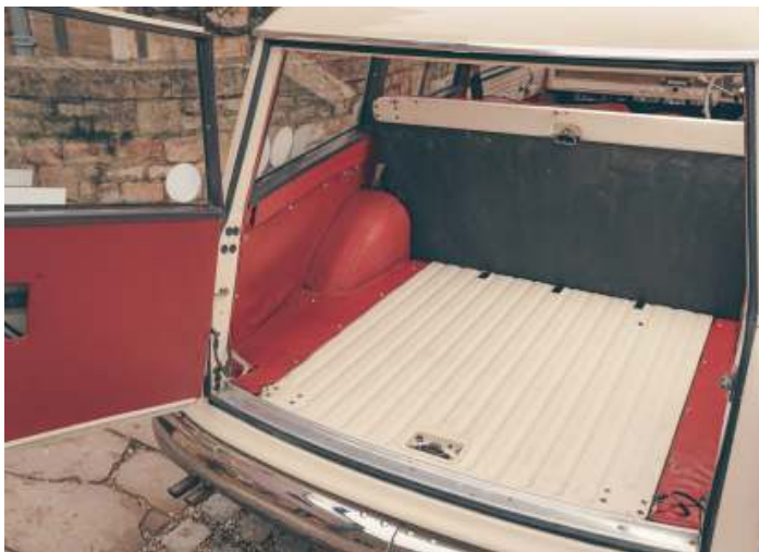
Een naar links openzwaaiende achterklep