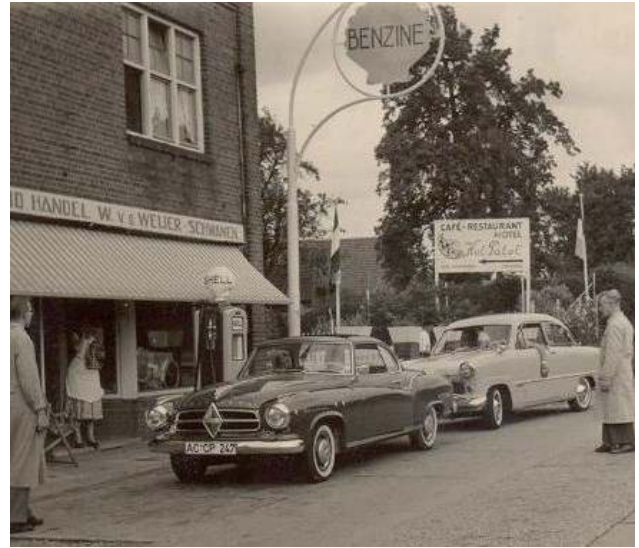
Rechtsboven: Waar zou dit zijn? Een fraaie coupé.